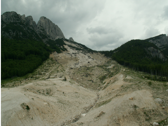
Plaz Log pod Mangartom