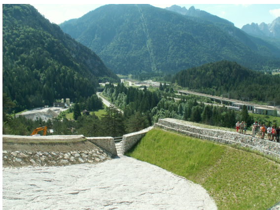
Iz zaplavnega prostora