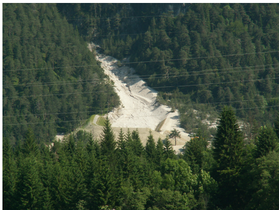
Pogled na pregrado od daleč