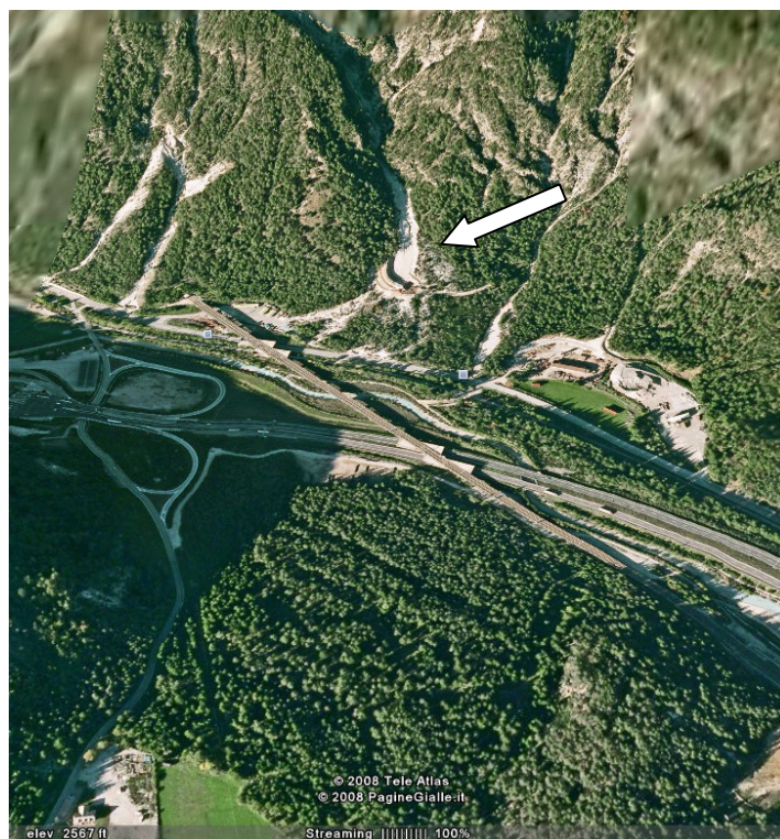
Pogled na zadrževalnik