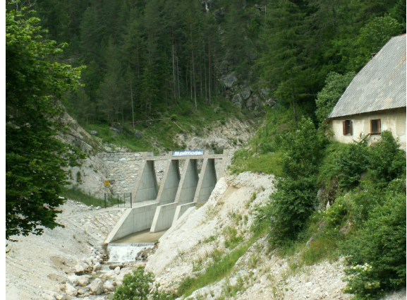
Razbijač energije na Predelici pred vtokom v Sočo