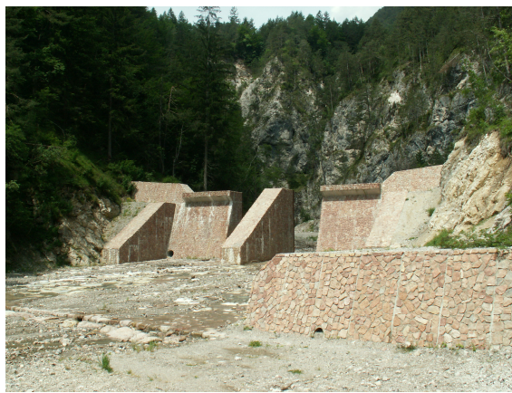
Razbijač energije na reki Ukva nad vasjo Ukve