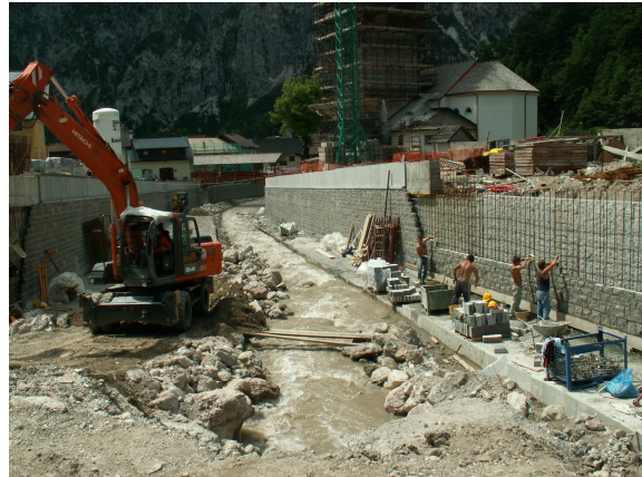
Urejevanje hudournika v Ukvah