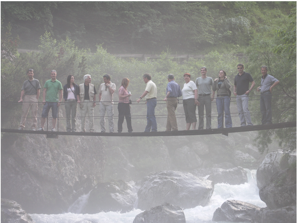
Na visečem mostu proti koritom Mlinarice