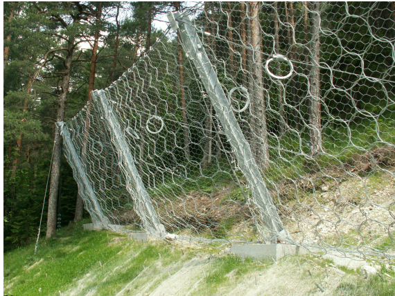
Žična ograja za lovljenje materiala