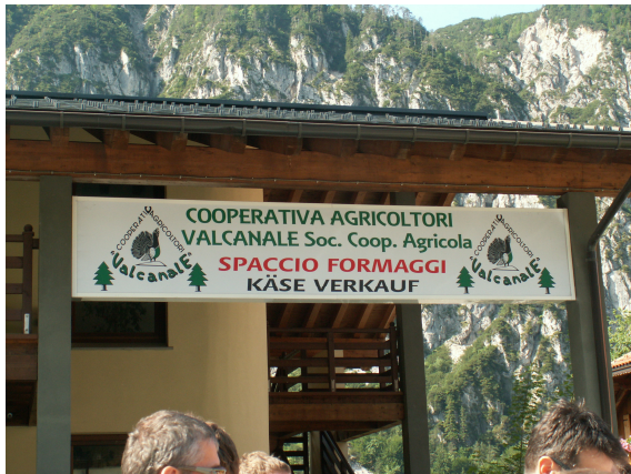
Zbrno mesto pred podjetjem Cooperativa Agricologi v Ukvah