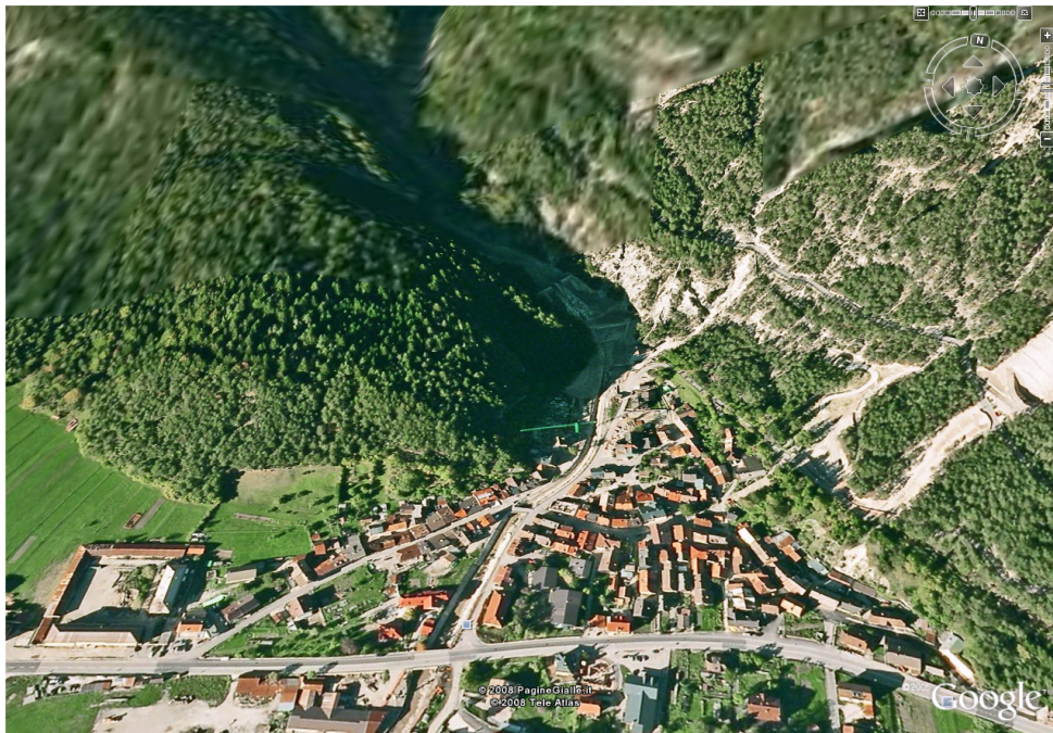
Pogled na vas Ukve